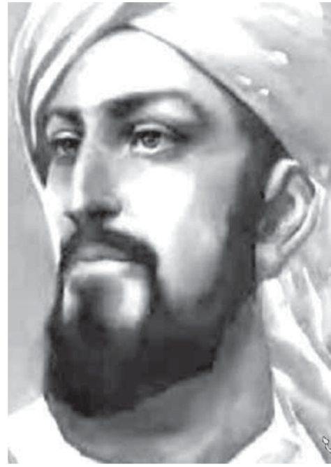
محي الدين بن عربي