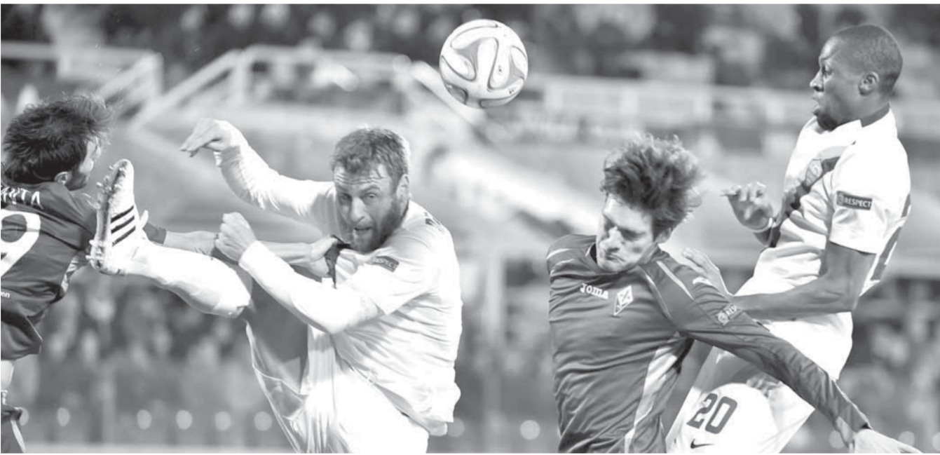
فيورنتينا روما قمة على صدارة السبيرا A

إلى الفوز والعودة إلى حلبة منافسة الكبار ولا سيما أنه لم يفز خلال الجولات الثلاث الأخيرة، يذكر أن ساسولو فاز مرتين على روزينيري بالموسم الماضي. ويسعى اليوبي إلى استدراك بدايته السيئة عندما يستضيف أتالانتا الذي لم يحقق أي فوز على اليانكوتنيري منذ ١١ عاماً في المسابقات كافة، وسجل اليوبي فوزين فقط مقابل ٣ هزائم ٣ تعادلات حتى الآن، والطريف أن أتالانتا يسبقه بأربع نقاط.