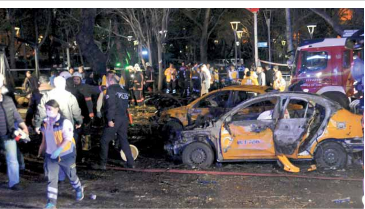
ساحة كيزيلاي التي تم استهدافها بسيارة مفخخة وسط العاصمة التركية مساء أمس