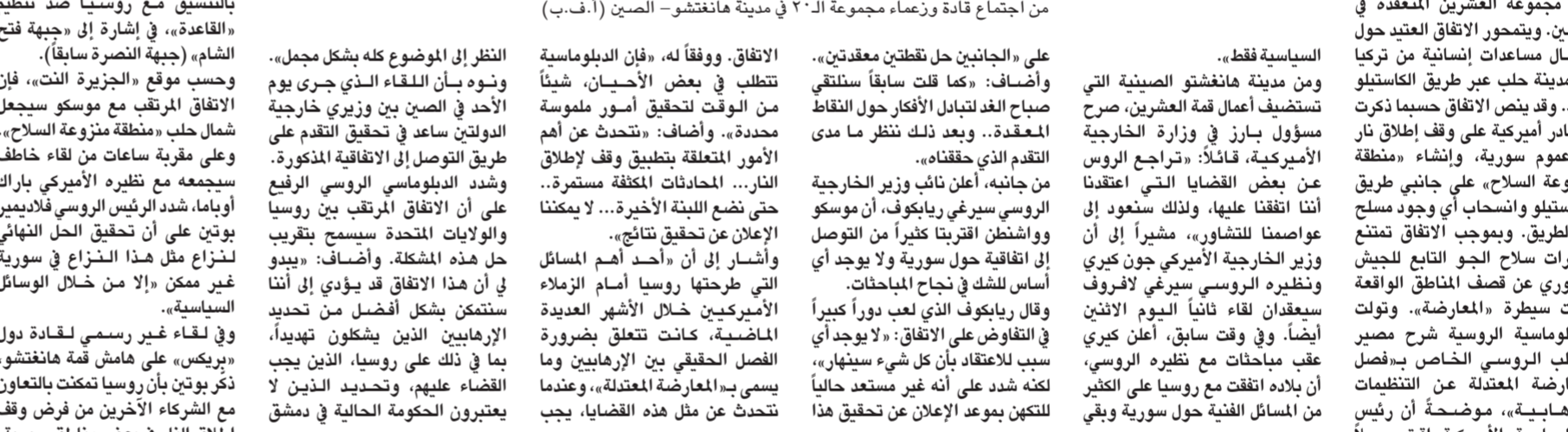
من اجتماع قادة ورؤساء مجموعة ٢٠ في مدينة هانغتشو - الصين

على «الجانبين كل طرفين معتدتين». وأضاف: «كما قلت سابقاً ستلتقي صباح الغد لتبادل الأفكار حول النقاط المعقدة.. وبعد ذلك ننظر ما مدى التقدم الذي حققناه». من جانبه، أعلن نائب وزير الخارجية الروسي سيرغي يانكوف، أن موسكو وواشنطن أقرتا كثيراً من التوصل إلى اتفاقية حول سورية ولا يوجد أي أساس للشك في نجاح المباحثات. وقال يانكوف خلال الأشهر العديدة الماضية، كانت تتعلق بضرورة الفصل الحقيقي بين الإرهابيين وما يسمى بالمعارضة المعتدلة، وعندما نتحدث عن مثل هذه القضايا، يجب