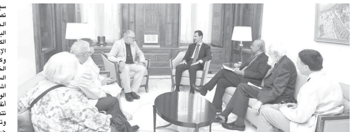
الرئيس بشار الأسد مستقبلاً الوفد البريطاني

سيتمكنون من نقل الحقيقة والعمل على تصحيح الرؤية الخاطئة لدى الحكومة البريطانية ولدى شريحة واسعة من البريطانيين عما يجري في سورية والمعاناة الكبيرة التي يواجهها السوريون بسبب جرائم الإرهاب. وكان الوفد البريطاني وصل دمشق يوم الخميس الماضي والتقى عدداً من المسؤولين السوريين حيث أكد رئيس الوفد أندرو اشداون أن هدف الزيارة التعرف على حقيقة الوضع في سورية والتحدث إلى السوريين أنفسهم للاطلاع على واقعهم بعيداً عما تتداوله وسائل الإعلام الغربية. وتأتي زيارة الوفد البريطاني إلى سورية بعد حراك شرق أسوي باتجاه دمشق، حيث قام وزير الدولة الهندي للشؤون الخارجية ميفر جاويد أكبر بزيارة إلى دمشق في ٢٠ آب الماضي استقبله خلالها الرئيس الأسد. كما تأتي الزيارة بعد حراك دبلوماسي غربي مكثف تجاه دمشق، حيث زارها مؤخراً وفد مجلس السلام الأميركي ووفد من البرلمان الأوروبي إضافة إلى وفد برلماني فرنسي ووفد سياسي يوناني.