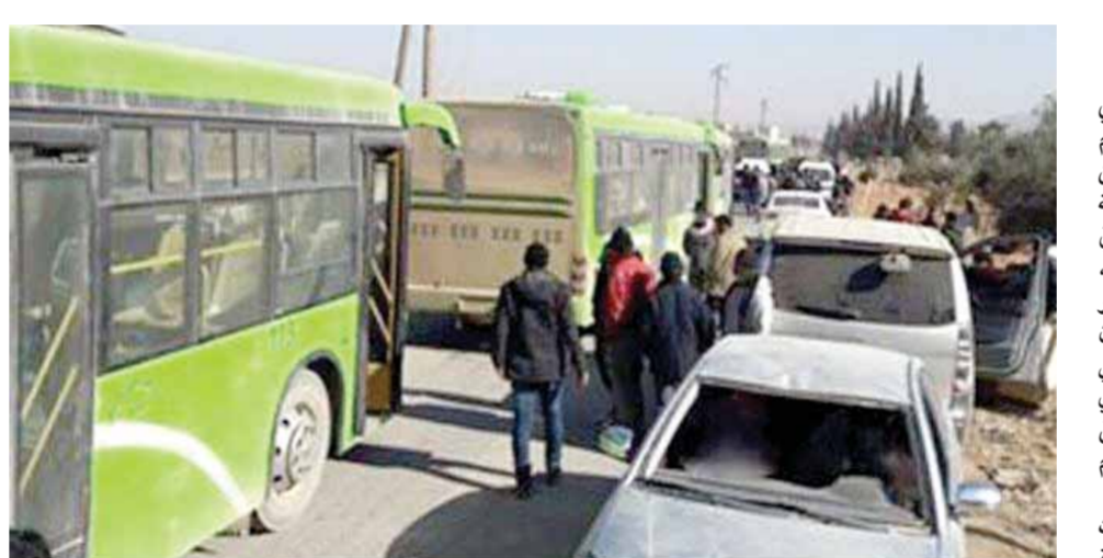
بدء تنفيذ بنود اتفاق تسوية خروج مسلحي ميليشيات المعارضة من مخيم خان الشيخ ومحيطه إلى إدلب (عن الانترنت)

جوز: داعش أظفر ما هو قادر على ارتكابه في أوروبا وكالات أكد نائب قائد «وحدة الاستراتيجيا والدعم» في «التحالف الدولي» الذي تقوده الولايات المتحدة في العراق الميجور جنرال روبرت جونز أنه «خلال عمليات تحرير البلدات والمدن من إرهابيي داعش تمت مصادرة عشرات الآلاف من الوثائق التي تعود إلى التنظيم الإرهابي في مراكز العمليات الخارجية له وتم الكشف عن عشرات الخطط لقتل المدنيين وتشويههم». وحسب ما نقلت وكالة «سانا» عن صحيفة «ديلي ميل» البريطانية، أضاف جونز: إن «هذا التنظيم أظهر بالفعل ما هو قادر على ارتكابه من جرائم إرهابية في أوروبا وغيرها من الأماكن وفي حال أردنا أن نبقى بريطانيا آمنة فسيكون علينا مواجهة».