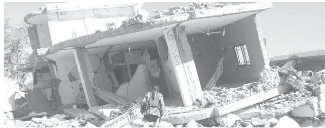
جانب من الدمار الذي خلفته طائرات التحالف بقيادة السعودية في جنوب غرب مدينة تعز

وعلى الحدود، قال الجيش اليمني واللجان الشعبية إنهم صدقوا هجماتهم على مواقع الجيش السعودي باستخدام صواريخ الكاتوشا، حيث أطلقوا ١٢ صاروخاً على مقر لشركة «بن لادن»، كبرى شركات المقاتلات في منطقة نجران، وأطلقوا نفس العدد من الصواريخ على مواقع حصن الحصاد كما استهدفوا بقذائف «الهاون» تجمعات للجيش السعودي في موقع علب العسكري بالمنطقة نفسها. كما ذكر الجيش اليمني واللجان الشعبية أن مسلحيها قصفوا تجمعات للجند السعوديين وألباتهم العسكرية خلف موقعي الطلعة والهرم وتجمعات أخرى في منطقة الطوال ومبنى الجوازات. كما استهدفوا بعدد من القذائف تحصينات الجيش السعودي في موقع المسيل في منطقة عسير. غير أن السلطات السعودية لم تتحدث عن تعرض أراضيها لأي هجوم من الجانب اليمني. هذه التطورات تزامنت مع تأكيد مكتب منظمة الأمم المتحدة للطفولة «اليونيسيف» في بيان أنه تحقق من مقتل ١,٣٣٩ طفلاً على الأقل جراء الصراع في البلاد خلال الفترة (٢٠١٥ - وحتى تشرين الأول الماضي)، وقال إن هذا الأمر مرفوض جملة وتفصيلاً. روسيا اليوم