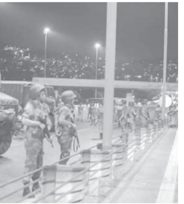
قوات عسكرية منتشرة في المدن التركية

وكان فرانسوا فيون رئيس الوزراء الفرنسي الأسبق قد فاز الأحد في الانتخابات التمهيدية لليمين الفرنسي للانتخابات الرئاسية عام ٢٠١٧ متقدماً