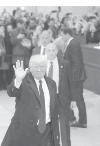
الرئيس الأميركي المنتخب دونالد ترامب

كلينتون حسب عدد أصوات الناخبين التي أدلت لصالحها، بفارق يبلغ مليوني صوت. من جهة أخرى هدد ترامب بوقف التقارب في العلاقات مع كوبا إذا لم تقدم هافانا تنازلات حول حقوق الإنسان وتفتتح في اقتصادها. وقال ترامب في تغريدة على «تويتر»: «إذا كانت كوبا غير راغبة في تقديم اتفاق أفضل للشعب الكوبي، وللشعب الأمريكي من أصل كوبي والولايات المتحدة عموماً، فسأنهي الاتفاق» الذي أعلنه الرئيس باراك أوباما في ١٧ كانون الأول ٢٠١٤ ونظيره الكوبي راؤول كاسترو. والأحد أبتت إدارة أوباما على الغموض حول مواصلة سياسة الاتفاق على الجزيرة الشيوعية مطالبة ب«اتفاق أفضل» من ذلك الذي أبرمه الرئيس أوباما. وبيما ندت شخصيات من الجمهوريين والطلاب إلى الاحتما. الجمعة عن ٩٠ عاماً، لم يهدد أحد بوضوح بنهاء التقارب الذي يشكل أحد أبرز إنجازات الإدارة الديمقراطية المنتهية ولايتها. لكن أوساط ترامب سبق أن حذرت من أن باراك أوباما قدم الكثير من التنازلات لهافانا وخصوصاً عبر تخفيف الحظر الاقتصادي الأميركي المفروض عام ١٩٦٢ من دون الحصول على مقابل من هافانا حول حقوق الإنسان أو الديمقراطية أو اقتصاد السوق.