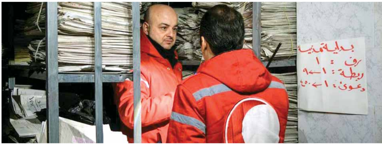
الهلال الأحمر في حلب ينقل ملفات قانونية ويسلمها إلى الجهات المعنية في القصر العدلي

الأوسط، مشيراً إلى المباحثات الثلاثية في موسكو حول سورية «بمساهمة أميركية تساوي الصفر»، التنتظيمات الإرهابية والمليشيات المسلحة في سورية بالتصديق على مشروع قانون يتضمن بنوداً لتسليم تلك التنظيمات ويحدد سبل تسليم منظومات الدفاع الجوي إلى الإرهابيين والمسلحين.