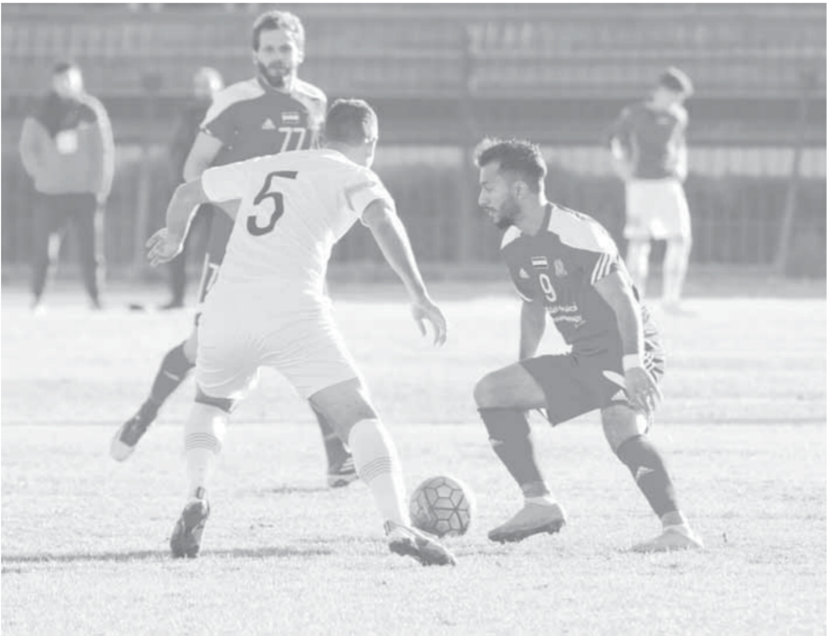
من مباراة الجيش والوحدة

ولتكون لهم الفرص متوافرة سواء على صعيد الأندية الممتازة أم على صعيد المنتخبات الوطنية. هذا القرار لا يشكل أزمة لدى الأندية، لأن أنديتنا بالأصل معروفة بكثرّة تبديل المدربين، والبحث عن مدرب مناسب بحمل الشهادة المطلوبة ليس عسيراً، لكن المشكلة في الأندية وماذا تريد؟ وحسن في كل موسم نقيم دورات تدريبية للمدربين، والكثير من مدربيننا يلتحق بهذه الدورات للرفع من بالدول العربية، ونحن نسأل المدربين الذين لم يحصلوا على هذه الشهادة، لماذا لم تتحققوا بالدورات التدريبية؟ وهل يظن هؤلاء أن شهادة B ستفقيهم مدى الحياة؟