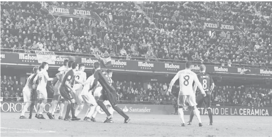
ركلة ميسي أنقذت البرشا من الهزيمة

سان سيرو والثامن بفارق هدف هذا الموسم. وكان جاره إنتر قد افتتح مباريات الأحد بفوز صعب على أرض أودينيزي الذي تقدم بالنتيجة قبل أن يقبل الطالوة النديرأوري بفضل نجمه الكرواتي بيرسيتش الذي سجل هدفي الفوز وهو الثالث بهذه الطريقة بعد بيسكارا ويوفنتوس وهو فوزه الرابع خارج ميلانو.