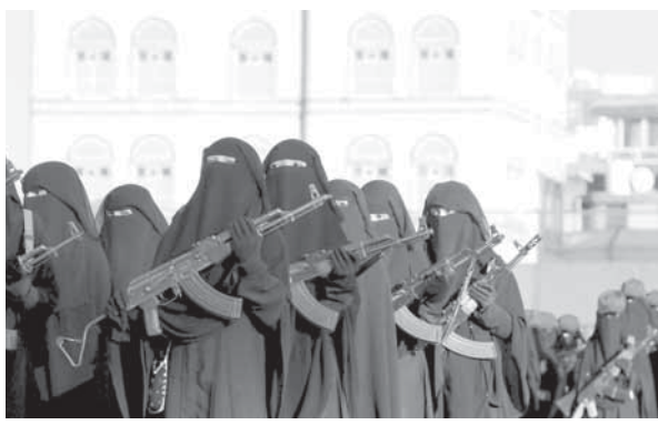
نساء تطوعن للانضمام للمقاومة الشعبية في صنعاء

لطائرات التحالف السعودي على مناطق الشريط الحدودي محافظة صعدة مع السعودية وأعلنت دماراً كبيراً بالممتلكات هناك، وقال الجيش اليمني واللجان الشعبية: إن طيران التحالف شن أكثر من ١٤ غارة استهدفت عدداً من المناطق في المحافظة الواقعة على الحدود مع السعودية - منها ٧ غارات على مناطق متفرقة بن فاضل بمديرية حيدان، ومثلها على منطقة الفرع بمديرية كتاف، وغارة على منطقة النصبة بمديرية الظاهر، في ظل تحليق مكثف على أغلبية مديريات المحافظة، هذا وقيل ساعات من وصوله إلى صنعاء لتسليم عبر وقف القتال ثم تشكيل حكومة وحدة وطنية.