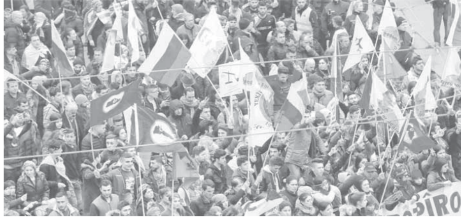
تظاهرة قام بها الأكراد في فرانكفورت، ألمانيا

أكد الناطق أن رأس السنة الكردية (النوروز) الذي يصادف الثلاثاء استخدم «ذريعة» لتظاهرة كردية. وكان الناطق باسم الرئاسة التركية قال في بيان إن تركيا «تدين بأشد العبارات» السماح بهذه التظاهرة، وأضاف: «من غير المقبول رؤية رموز وشعارات حزب العمال الكردستاني (...) على حين يمنح وزراء وبرلمانيون أتراك من الاجتماع مواطنيهم»