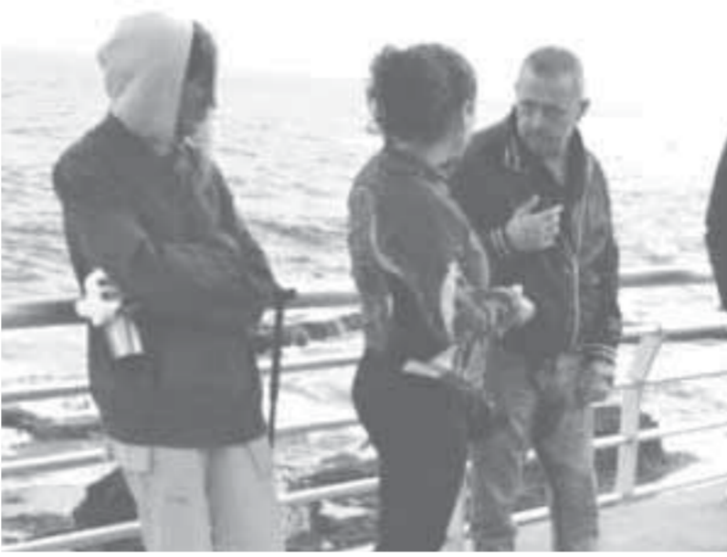
جورج وسوف يلتقي محبيه