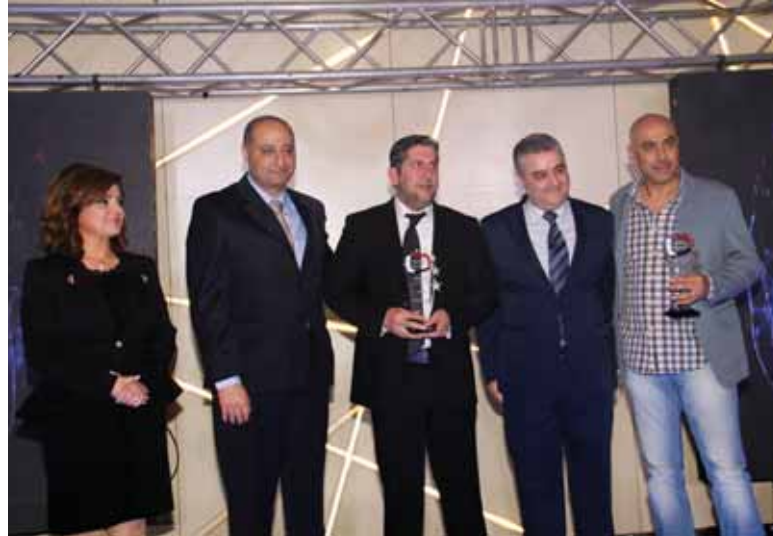
وزير الإعلام ومدير عام الهيئة العامة للإذاعة والتلفزيون ومديرة قناة سورية دراما بكرمون أسرة مسلسل «بانتظار الياسمين»