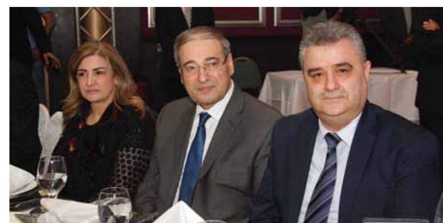
نائب وزير الخارجية والمغتربين فيصل المقداد وعقبته مع وزير الإعلام