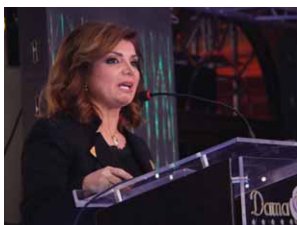
مديرة قناة سورية دراما وائدة وقاف

نظراً لعلوائه اللامحدود الذي يصل حد الدهشة، وتاريخه الفني الغني والتميز، أحدثت قناة «سورية دراما» جائزة العطاء الإبداعي بموسمها الأول، ومنحتها للفنان الكبير بمقامه وعطائه دريد لحام، آخر نجوم الزمن الجميل، وأحد أهم مؤسسي الدراما والسينما والمسرح في سورية. من أهم أعماله الدرامية «صبح النوم»، «حمام الهنا»، و«ملح وسكر»، و«مقالب غوار»، و«أبو الهنا»، و«عائلتي وأنا»، و«وادي المسك»، و«وين الغلط»، و«الخربة»، و«سعود بعد قليل». من أعماله المسرحية المتميزة «غربة»، و«ضيعة تشرين»، و«شقائق النعمان»، و«عقد اللؤلؤ»، و«كناكسك يا وطن». ومن أفلامه السينمائية الشهيرة «سك بلا حسل»، و«خياط للسيدات»، و«مسك وغنير»، و«لاعب الكرة»، و«مقلب في المكسيك»، و«سيليكا»، و«غوار جيمس بوند».