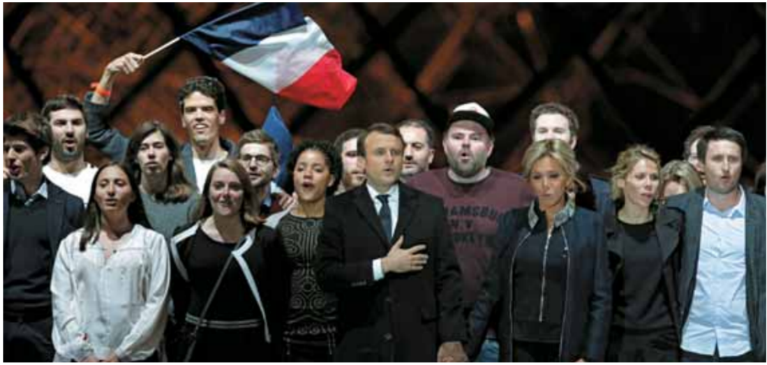
الرئيس الفرنسي المنتخب إيمانويل ماكرون وزوجته بريجيت تروغنوكس يحتفلان مع أنصاره بالقرب من متحف اللوفر في باريس

بدورها اعتبرت المستشارة الألمانية أنجيلا ميركل أمس أن الرئيس الفرنسي المنتخب إيمانويل ماكرون يمثل أمال «ملايين» الفرنسيين والكثير من الأشخاص في ألمانيا وأوروبا.