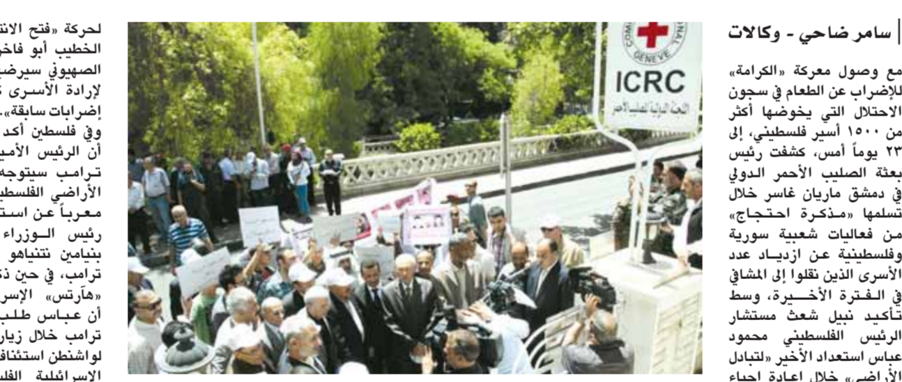
وقفة تضامنية مع الأسرى في السجن الإسرائيلي أمام مكتب بعثة اللجنة الدولية للصليب الأحمر بدمشق