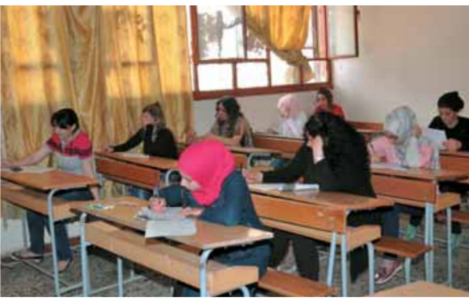
وروقت حالات ضبط غش، كما تمت إحالة رؤساء المراكز والمستخدمين والمواطنين من أهالي الطلاب المدنيين والعسكريين المواطنين في الغش إلى الأمن الجنائي

اتسم اليوم الأول من امتحانات شهادة التعليم الأساسي في محافظة حماة، بإعادة الاعتبار والهيبة والقيمة للامتحانات، بفرض الجهات المعنية والمسؤولة النظام والأنضباط على العملية الامتحانية عموماً التي كانت تخترق خلال الأعوام السابقة اختراقات فاضحة.