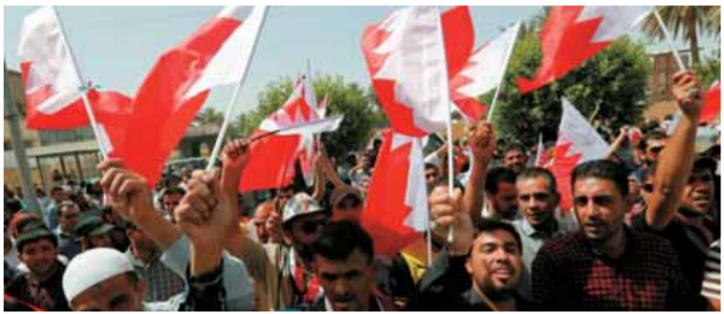
احتجاج عراقيين أمام السفارة البحرينية في بغداد ضد اعتقال الشيخ عيسى قاسم

استنكر حزب الله قيام قوات نظام آل خليفة في البحرين بالاعتداء الوحشي على المتصممين في بلدة الدراز غرب العاصمة المنامة تضامناً مع رجل الدين الشيخ عيسى قاسم واقتحام منزلته، مؤكداً أن أي مس بسلامة سيؤدي إلى احتمالات لا يستطيع أحد توقع نتائجها. وكان خمسة أشخاص قتلوا الثلاثاء برصاص قوات أمن نظام آل خليفة في البحرين إضافة إلى إصابة العشرات بجروح وحالات اختناق خلال مهاجمة قوات النظام اعصاماً بقتله محتجون بحرينيون تضامناً مع الشيخ قاسم في بلدة الدراز. وحمل الحزب في بيان له نظام بني سعود كامل المسؤولية عما حصل ويحصل في البحرين، مشدداً على أن الشيخ قاسم رمز الوطنية وضمانة السلم الأهلي وصاحب الفكر الإسلامي المعتدل الذي اعتدى عليه بسبب جنسيته وتعرضه للمحاكمة الظالمة. وطالب الحزب دول العالم والمنظمات الحقوقية والإنسانية بأن يسارعوا إلى استنكار هذه الجريمة والعمل لحفظ سلامة وكرامة الشيخ قاسم منوهاً بمواقفه الوطنية ومواقف البحرينيين المتضامنين معه. إلى ذلك وبدورها أعلنت الرياض وأبوظبي دعمها لعملية التي نفذتها قوات الأمن البحرينية في بلدة الدراز الشعبية غرب المنامة الثلاثاء، مؤكدين أن أمن المملكة الخليجية الصغيرة «جزء لا يتجزأ» من الأمن الخليجي.