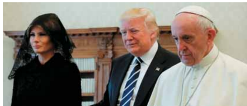
ميلانيا ترامب «السافرة» عند آل سعود. «محشمة» في حضرة البابا

وقال مستشار البيت الأبيض للأمن القومي الجنرال هيريت ريموند ماكاستر «هذه الزيارة تاريخية فعلاً، لم يسبق لأي رئيس أن زار مراكز الديانات اليهودية والمسيحية والمسلمة ومواقعها المقدسة في رحلة واحدة، ما يحاول الرئيس ترامب القيام به هو توحيد الشعوب من جميع الديانات حول رؤية مشتركة تقوم على السلام والتقدم والإزدهار». وبعد اللقاء، انصرف البابا فرنسيس لعقد جلسته الأسبوعية الاعتيادية كما في كل يوم أربعاء أمام آلاف المؤمن في ساحة القديس بطرس، فيما قام ترامب بزيارة خاصة إلى كنيسة سيستينا وكان البابا فرنسيس قد قبل عشرة أيام بشأن زيارة ترامب «ساعياً عن أفكار، وسعيهم هو عن أفكار»، مؤكداً أنه «لا يحكم أبداً على شخص من دون الاستماع إليه».