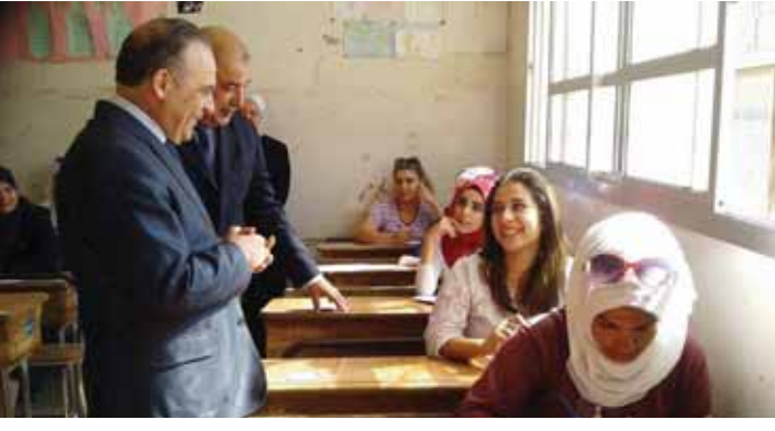
الشهادة الثانوية هو إحدى ثمار انتصارات التنظيمات الإرهابية المسلحة معتبراً أن إرادة قوات جيشنا العربي السوري بمواجهة السوريين على مواصلة العلم تشكل رسالة

لأنه عندما يكون القطاع التربوي بخير تكون الطاعات الأخرى بخير، فالعملية التربوية أساس مستقبل الوطن. لذلك كان حرص وزارة التربية على إقلاع العام الدراسي منذ اليوم الأول، مصيفاً أجرياً امتحانات شهادة التعليم الأساسي والامتحانات الانتقالية في وقتها المحدد، ويستبقى مدارسنا صروحاً للعلم والمعرفة.. وأكد وزير التربية أن الوزارة تتابع كل ما يتعلق بالعملية الامتحانية على مدار الساعة، وتقوم بالإجراءات المناسبة والحازمة عندما يكون هناك أي خلل مهما كان صغيراً وتعالجه فور وقوعه، ولن تتهاون في اتخاذ أي إجراء بحق المخالفين، متصيناً للأبناء الطلبة الامتحانات هادئة ومرحة والابتعاد عن الخلل والتوقعات التي من شأنها خلق الفلك والتوتر لديهم.