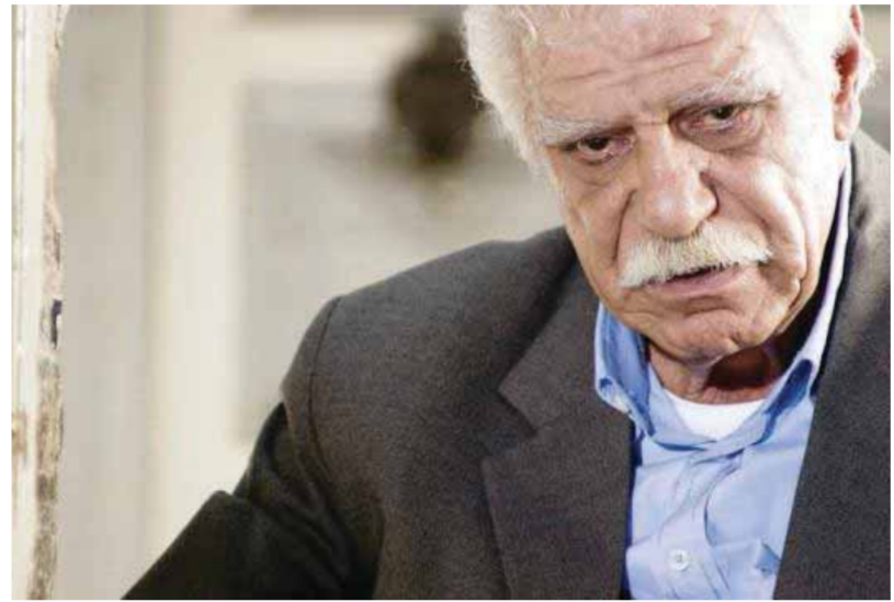
من أحد أعماله

في سن الثامنة من عمره، اكتشف أنه مولع بالرسم، وأغرم بخيال الظل. وفي العاشرة، بدأ يتردد على مسارح دمشق السبعية كـ«النصر»