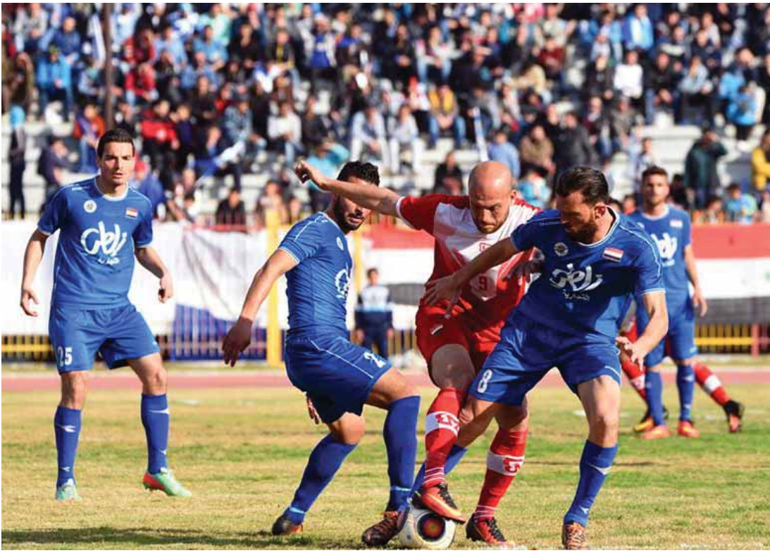
من لقاء حطين والاتحاد في نهاب الدوري

على الرغم من أن حطين يتصف بالتذبذب بالأداء فيوماً يقدم الكثير ويوماً لا يقدم شيئاً، والفرصة اليوم أمامه لفعل الكثير، الغيابات عن الاتحاد لا تعني أن الفريق سيكون ضائعاً فليده البديل المناسب وإن كانوا لا يملكون شهية المهدي التهديفة إلا أنهم يملكون الإمكانيات، المبراة مرجحة للوصول لركلات الجزاء الترجيحية بعد التعادل بوقت المباراة الأصلي.