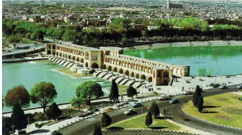
من آثار وطبيعة إيران