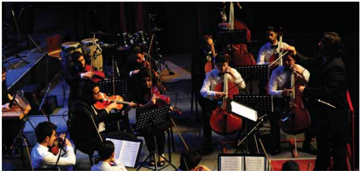
أوركسترا معهد صلمي الوادي

الحرف اليدوية للأيدي المبدعة أصابع مرهفة رشيقة ودقيقة إن الشوق إلى معانقة الفضائل في الفن وحده يتجلى