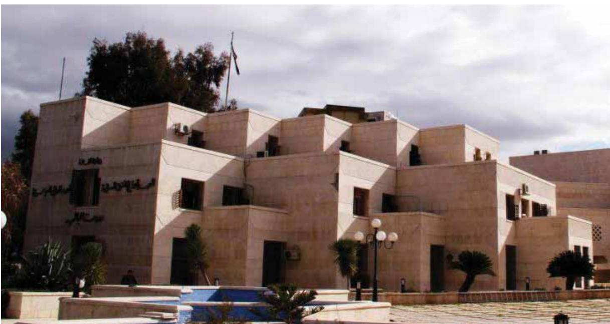
المعهد العالي للموسيقا