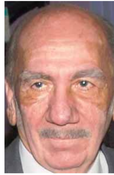
محفوظ عبد الرحمن

وحظي بتقدير كبير جسده عمليات تكريم وجوائز في مصر ومنها «جائزة الدولة التشجيعية» العام ١٩٧٢ و«جائزة الدولة التقديرية» في الفنون العام ٢٠٠٢ و«جائزة النيل» في الفنون العام ٢٠١٣ وهي أرفع