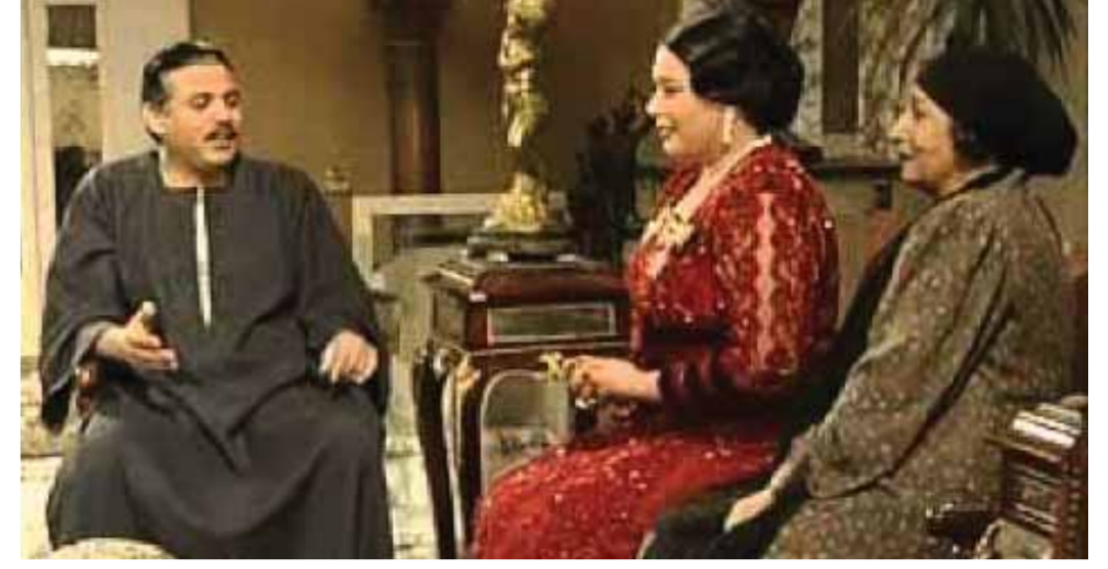
من مسلسل أم كلثوم