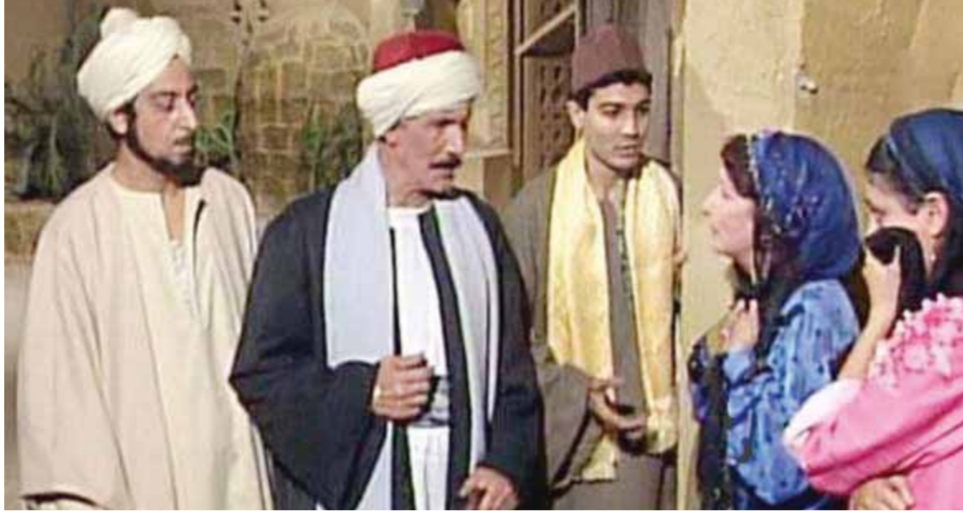
من مسلسل بوابة الحلواني