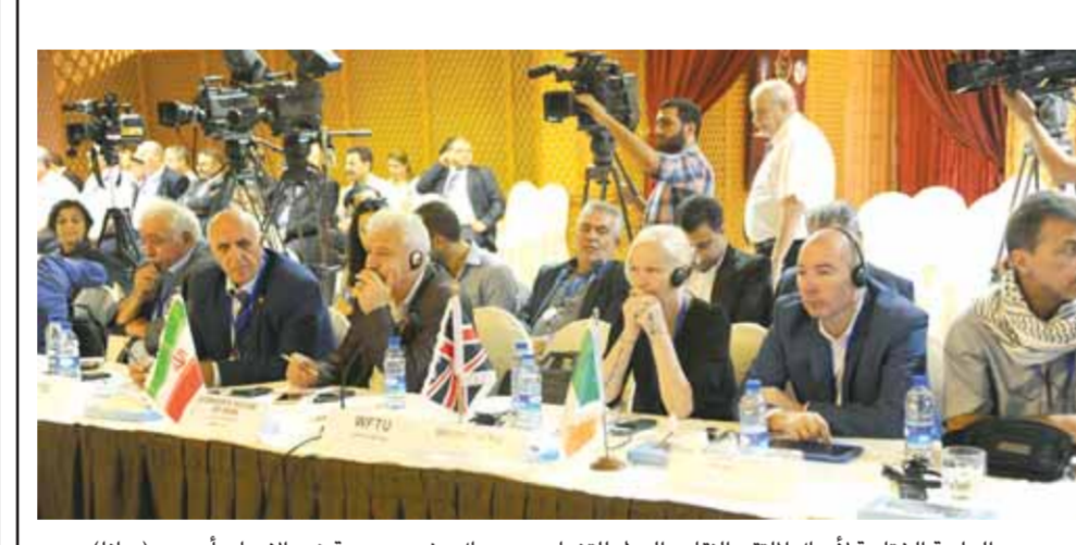
من الجلسة الختامية لأعمال الملتيقى النقابي الدولي للتضامن مع عمال وشعب سورية ضد الإرهاب أمس