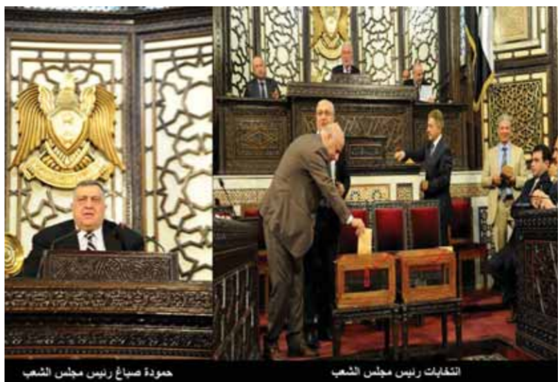
حمودة صباغ رئيس مجلس الشعب

مع الأخذ بالحسبان الملاحظات التالية: × ذكرنا اسم رئيس المجلس التمثيلي والنيابي لسلطة دولة دمشق وهو يمثل دمشق وبعض المناطق فقط ولا يمثل سورية، لكون المحتل