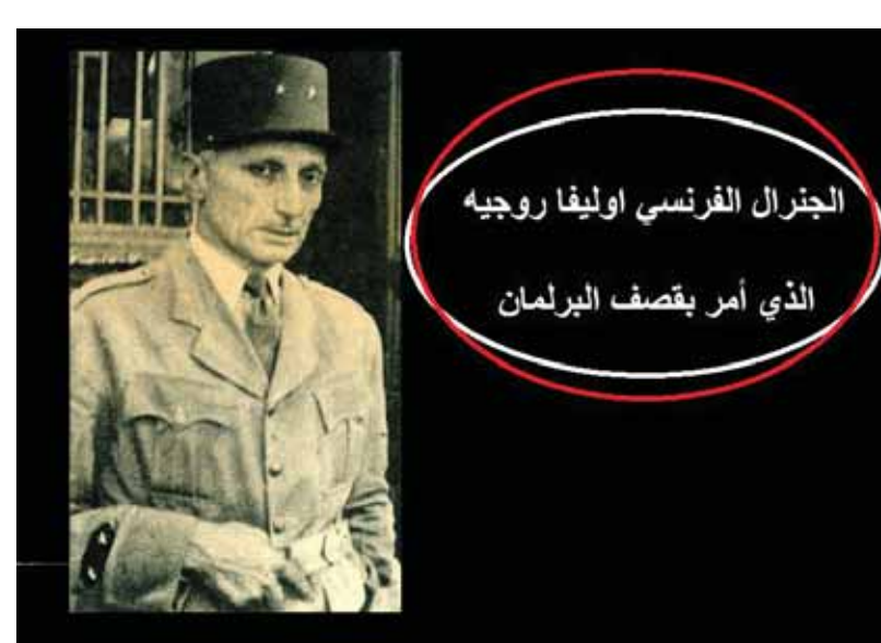
الجنرال الفرنسي أوليفار روجية الذي أمر بقصف البرلمان