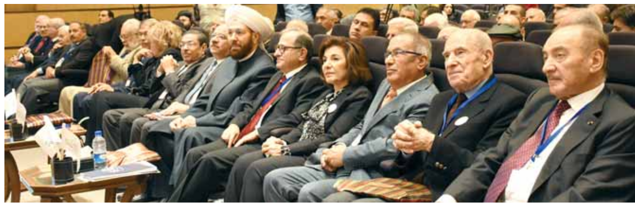
جانب من حضور فعاليات المؤتمر الحواري الأول لـ «وثيقة وطن» الذي عقد في مدرج جامعة دمشق أمس