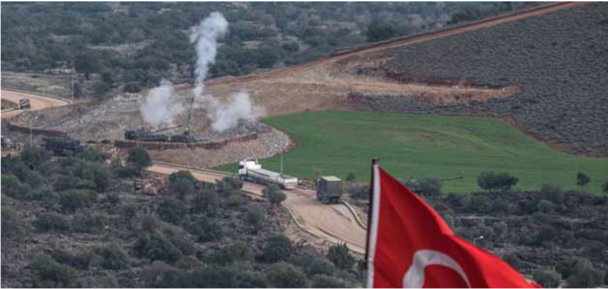
المدفعية التركية تستهدف مواقع للأكراد في عفرين

وقف هذا العدوان فوراً، على حين أكد الطلبة السوريون الدارسون في فرنسا، تحيد عن المعركة الأساسية، ضد الإرهاب. أما وزير الخارجية الفرنسي جان إيف لودريان، فأعلن أن بلاده تدعو لعقد جلسة طارئة لمجلس الأمن الدولي لبحث الأوضاع في سورية بعد أحداث عفرين، داعياً بحسب وكالة «سيوتنك» إلى وقف إطلاق النار بشكل كامل في سورية والسماح بإيصال المساعدات الإنسانية من دون شروط مسبقة. وفي سياق متصل استنكر رئيس «الاتحاد الدولي لنقابات العمال العرب» جبال المراني في تصريح نقلته «سانا» من القاهرة الصمت الذي تجاه عدوان الأراض التركي على السيادة السورية داعياً إلى