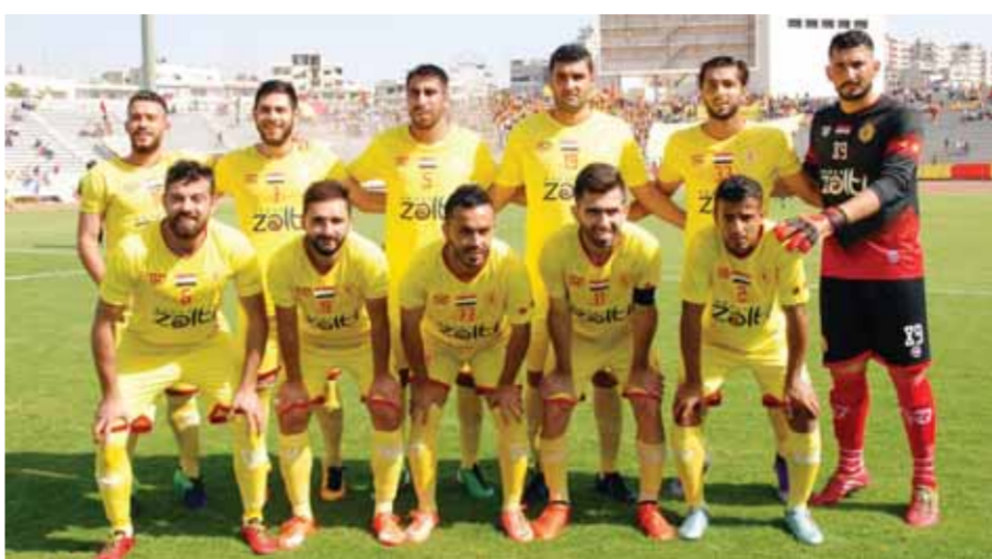
تشرين وصيف الموسم الماضي

لِفاجئهم صفيهم بهدف نجح فيه بالحق الهزيمة الثالثة لهم، وهنا بدأ الضغط الجماهيري يزداد على اللاعبين رغم الفوز على الجهاد بدمشق من ركلة جزاء لكن الأداء بالمجمل لم يكن ليرضي شغف وعطش جماهيره.