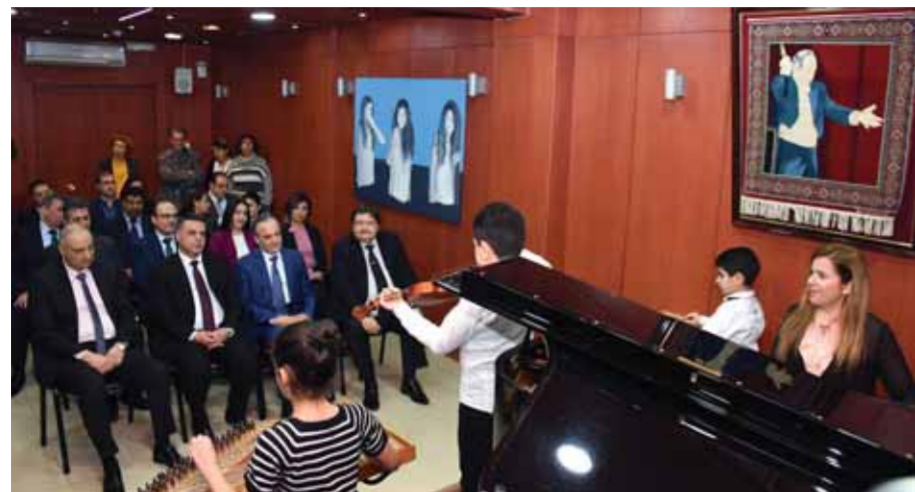
... في زيارة لمعهد صلحي الوادي