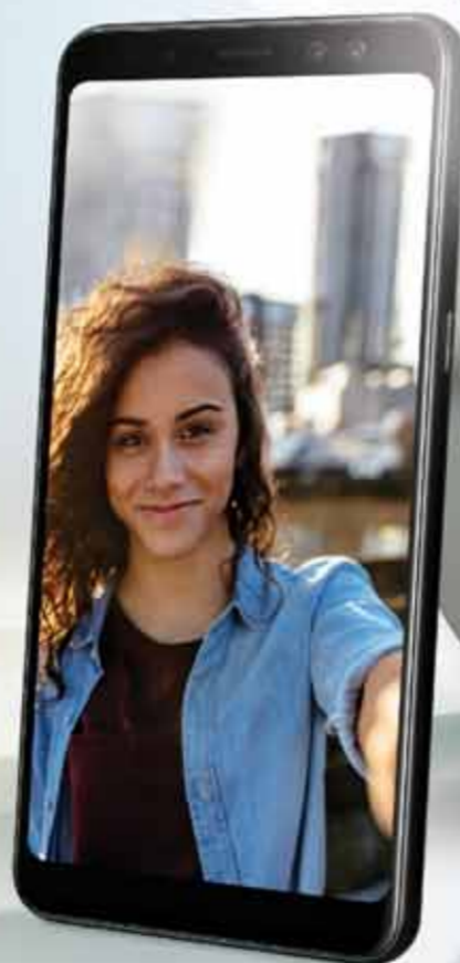
Galaxy A8 | A8+