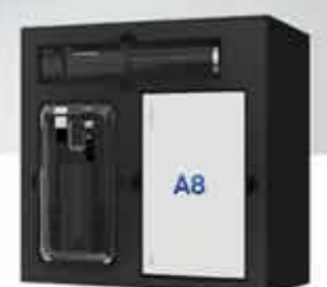
الكمية والفترة محدودة

SAMSUNG WhatsApp Chat No. 0969699199 Live Chat Samsung.com