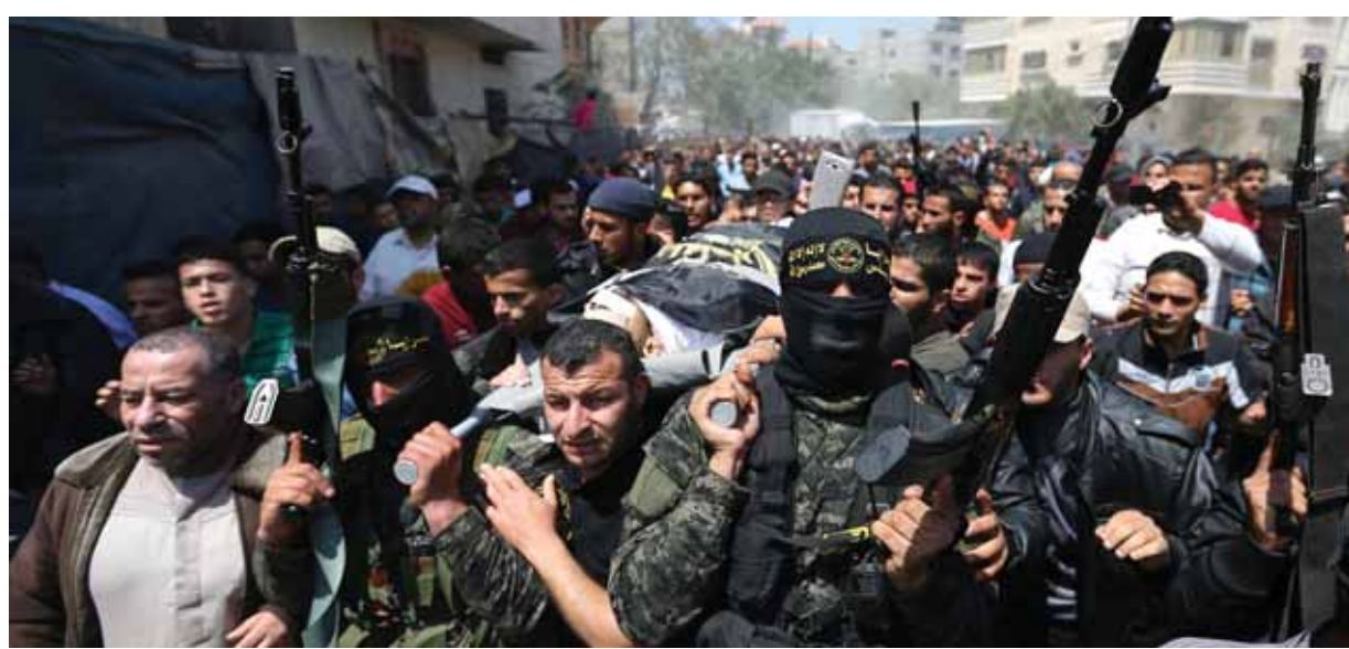
تشبيح أحد مقاتلي الجهاد الإسلامي في غزة أمس

من الأحكام الأخلاقية والأدبية... وأضافوا: «أمر القناصة بإطلاق النار وقتل متظاهرين عرّز، لا يشكلون أي خطر على حياة الناس، هو نتاج آخر للاحتلال والفوقين العسكرية ضد ملايين الفلسطينيين، ولنشاط القيادة الفاسية في إسرائيل التي أخرجت المسار الأخلاقي عن حدوده.. إيذاء الأبرياء في غزة هو جزء مما هو مطلوب للحفاظ على نظام الاحتلال، وهذا ما يجب ألا نسمح باستمراره».