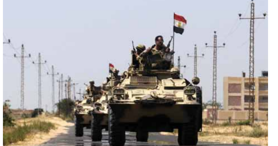
وحدات عسكرية من الجيش المصري في سيناء