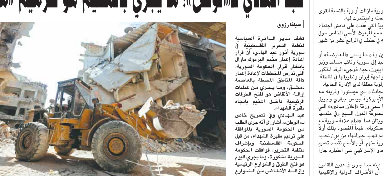
من عمليات إزالة الركام من شوارع مخيم اليرموك

اعتبر أن قرار إعادة إعمار «اليرموك» بيد الدولة السورية وطالب الأهالي بـ«الصبر» عبد الهادي لـ«الوطن»: ما يجري بالمخيم هو لترميم «مقبرة الشهداء»