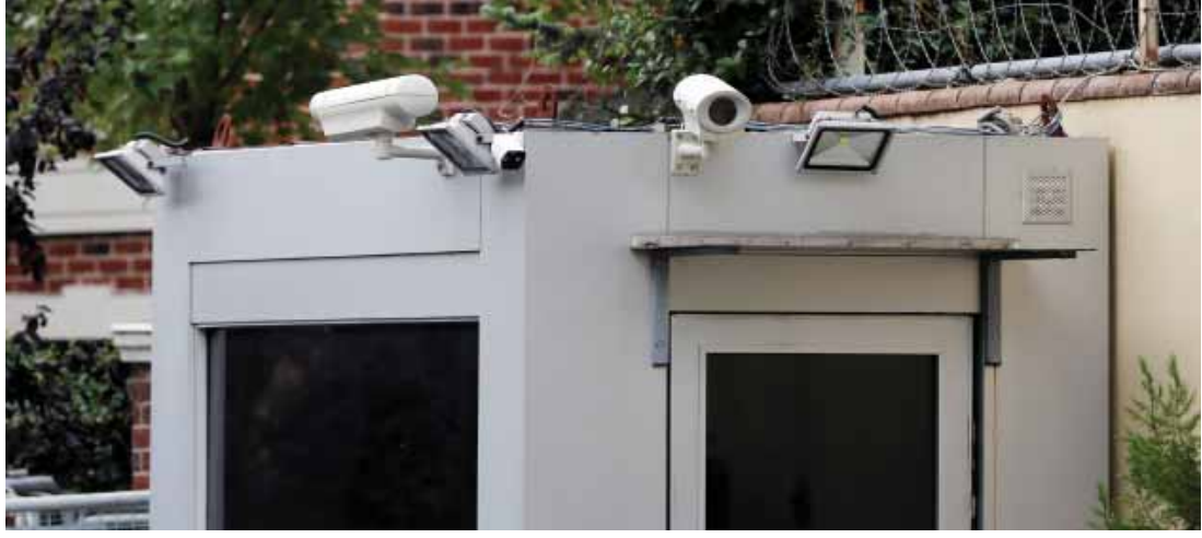
كاميرات المراقبة عند مدخل القنصلية السعودية في إسطنبول

كشفت وسائل إعلام تركية أمس الأربعاء عناصر تدعم فرضية الاختفاء القسري للصحافي السعودي جمال خاشقجي الذي قُتل بعد دخوله قنصلية بلاده في إسطنبول أو اغتياله بأيدي فريق جاء من المملكة، فيما طلبت خطيبته التركية مساعدة الرئيس الأميركي دونالد ترامب.