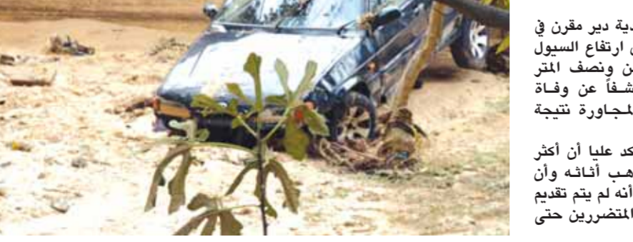
السيول تطول الناس وأماكنهم.. والمعنيون: الحل الجذري يحتاج إلى إمكانيات كبيرة