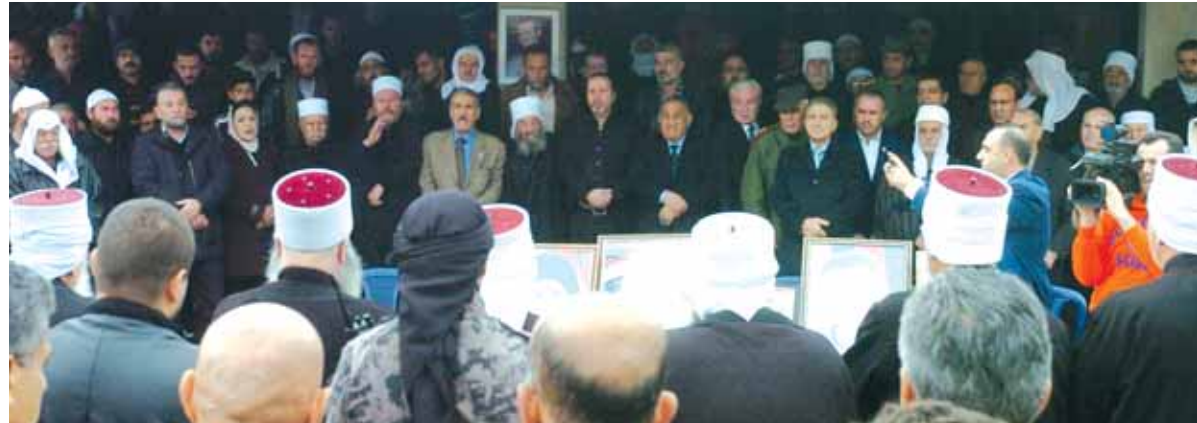
الوزير منصور عزام يهنيء مختطفي السويداء بتحريهم ويقدم التعازي بالشهداء الذين ارتقوا خلال عملية الخطف

مليشيات تركيا تنعى «اتفاق إدلب» وتعد لمعركة «مرتبة» مع الجيش