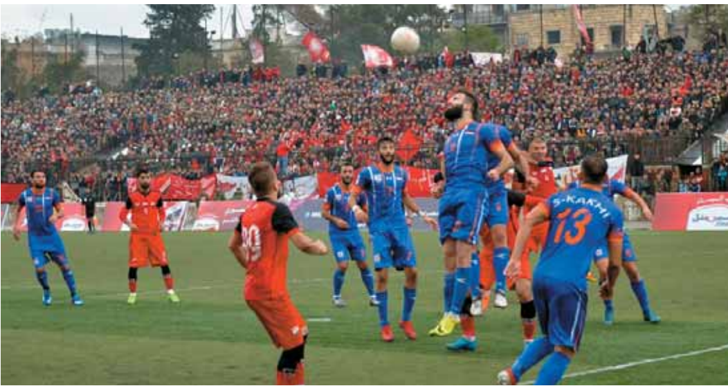
من القمة الممتعة

الاتحاد حاول في الثاني التسجيل حتى يستطيع ضبط المباراة كما يريد ونجح في سعاها حين نفذ العمري حرة مباشرة دخل عليها الغياش بقدمه من دون أي رقابة واستقرت عن يمين التسنان، الهدف منح أريحية لأصحاب الأرض مع فنون زكريا العمري الذي حمل فريق الاتحاد على عاتقه لما شهدنا أي حضور يمكن الحديث عنه بفضل براعة وسط الكرامة والرقابة الصليبية التي فرضت على فقاتنج اللعب وتم إبطائها للاتحاد مع كرة خطرة للعيان أوقفت قلوب الاتحاديين مرت بسلام ورأسية بالمقابل للتمر أخفق برتجمتها وهو بالقرب من المرمرى.