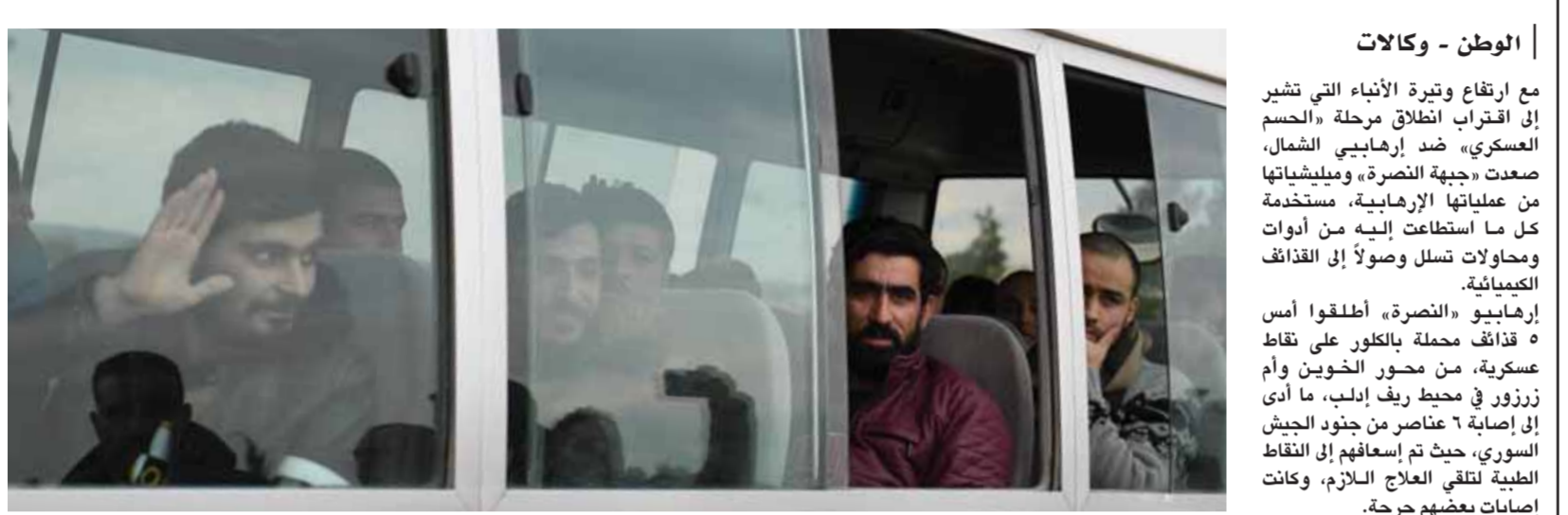
عودة المختطفين في بلدة دير قاق التابعة للباب بريف حلب الشرقي الذين تم تحريرهم من برائن المجموعات الإرهابية المسلحة أمس

مائدة في بروكسل وهو في طريقه إلى الولايات المتحدة، وحتى مضيفة المؤتمر بولندا، أكدت، وفق «أ ف ب»، أنها لا تزال ملتزمة موقف الاتحاد الأوروبي الداعم لاتفاق ٢٠١٥ الذي تقاوض عليه الرئيس الأميركي السابق باراك أوباما لتخفيف العقوبات على إيران مقابل فرضها قيوداً على برنامجها النووي. وأما الدول التي ستوفد مسؤولين كباراً إلى وارسو، فهي حسب «أ ف ب»، تلك التي تدعو لتشديد النجح حيال إيران وتشمل «إسرائيل»، التي يشارك رئيس وزرائها بنيامين نتانياهو في المؤتمر، و«هولندا» و«فرنسا» و«العرب على غرار الإمارات». وذكر نتانياهو، أن «إيران ستستمر جدول الأعمال إذ ستجري مناقشة كيفية مواصلة منعها من ترسيخ وجودها في سورية ومنع أنشطتها العدائية في المنطقة، والأهم من ذلك كله، كيفية منعها من الحصول على أسلحة نووية». إيران التي لم تدع إلى «وارسو»، استدعت السفير البولندي للاحتجاج، على حين سبّ سفيرا رئيسها حسن روحاني تزامناً مع انعقاد المؤتمر، إلى روسيا التي رفضت بدورها حضور المؤتمر، وسيلتقي روحاني في منتجع «سوتشي» بالرئيس الروسي فلاديمير بوتين، ونظيره التركي رجب طيب أردوغان مناقشة الوضع في سورية، وسط توقعات أن يتخضع عن قمة «سوتشي» قرارات تسهم في إيجاد حل سياسي لازمة في سورية.