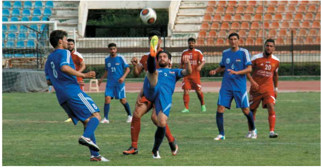
أحلام متناقضة بين الجيش والمجد

تنطلق اليوم مباريات الأسبوع السادس من إياب الدوري الممتاز مبكراً بمبارتين طرفاهما الجيش والاتحاد بسبب مشاركتهما في بطولة الاتحاد الآسيوي التي تنطلق جولتها الثانية يوم الإثنين القادم فلعب الجيش في بيروت بضيافة النجمة اللبنانية، بينما لعب الاتحاد في الإمارات مستقبلاً فريق النجمة البحريني، وتستكمل المباريات الخمس المتبقية يوم الجمعة القادم.