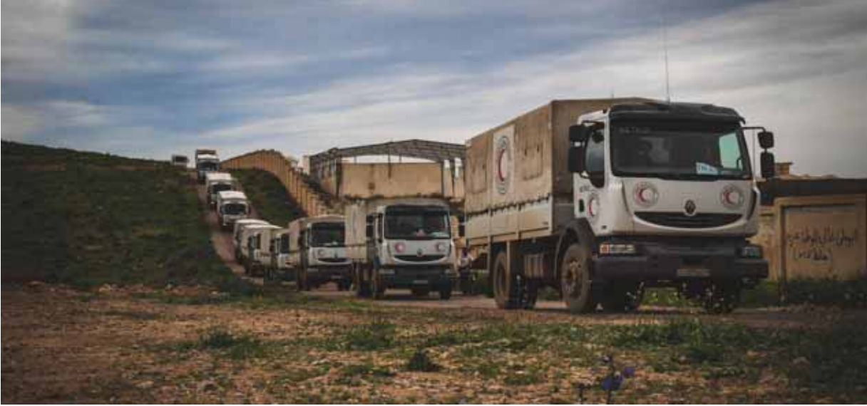
الهلال الأحمر يرسل قافلة مساعدات إغاثية إلى مناطق درعا البلد وطريق السد الأول

السد ليتم توزيعها على ٦٥٠٠ عائلة من القاطنين والمهجّرين العائدين إلى هذه المناطق». وأشارت إلى أن المساعدات تضمنت ٦٥٠٠ سلة صحية و٢٥٠٠ سلة صحية للأشخاص ذوي الاحتياجات الخاصة و١٠٠٠ مؤلفة من ٣٥ شاحنة على أحياء مجموعة أبسة شتوية مقدمة