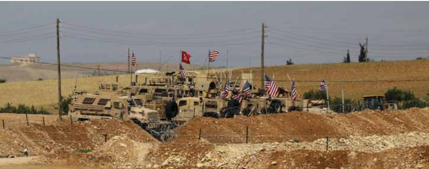
قوات الاحتلال الأميركي ترسل تعزيزات عسكرية إلى شرق الفرات

تسافة قرب منزل قيادي محلي في «قسد» في منطقة أبو محام، ما تسبب بقتل شاب وإصابة القيادي. وفي السياق، انفجر لغم في منطقة هجين بريف دير الزور الشرقي، ما تسبب باستشهاد شاب وإصابة طفل بجراح بليغة أذا لتبت ساقه، في حين استشهد رجل وزوجته الحامل مع اثنين من أبنائه جراء انفجار لغم في قرية التوامية بريف دير الزور، كما تسبب التفجير بإصابة سيدة من العائلة ذاتها بجراح، وفق «المرصد».