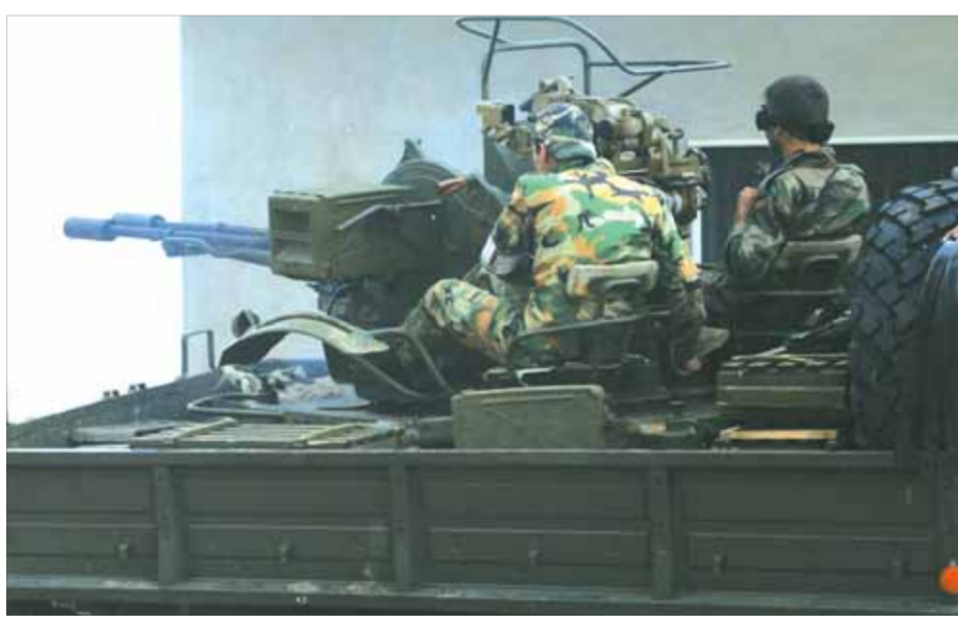
عناصر من الجيش العربي السوري في ريف حماة الشمالي في حالة الاستعداد للرد على خروقات الإرهابيين

السوري على الأرض، ألقى النظام التركي بكل ثقته إلى جانب الإرهابيين في معركة إدلب والأرياف المحاصرة لها والتي حقق الجيش السوري تقدماً لافتاً منذ انطلاقته، ورجحت أنقرة بالمثل من إرهابي ريفي حلب الشمالي والشمالي الشرقي إلى جانبهم في جبهات أرياف حماة وإدلب. وتكثفت مصادر محلية وأخرى معارضة مقربة من ميليشيا الجيش الوطني، في المناطق التي احتلتها تركيا خلال عمليات «درع الفرات» و«غصن الزيتون» شمال وشرق شرق حلب له «الوطن» أن نظام رجب طيب اردوغان وجه بدعم ميليشياته المسلحة في جبهات إدلب وحماة بأعداد غفيرة من إرهابي «الجيش الوطني» الممول والمدار من قبله. وأوضحت المصادر أن أكثر من 500 إرهابي من ميليشيا «أحرار» الشرقية، نقلوا أمس من أرياف حلب إلى خطوط التماس في ريفي حماة والشمالي الشرقي بعد يوم واحد من نقل عدد مشابه من ميليشيا «الجبهة الشامية» إلى سهل الغاب محاولة صد تقدم الجيش السوري على الأرض، مشيرة إلى أن مجموع المسلحين الذين وصلوا بلغ أكثر من 2500 إرهابي. وأفاد مصدر ميداني له «الوطن»، أن وحدات الاستطلاع في الجيش رصدت مرور إرهابيين من حلب إلى حماة عبر قرى جبل الزاوية في إدلب بدل نقلهم عبر سهل الغاب فكان لهم سلاح الجو في الجيش بالمرصاد.