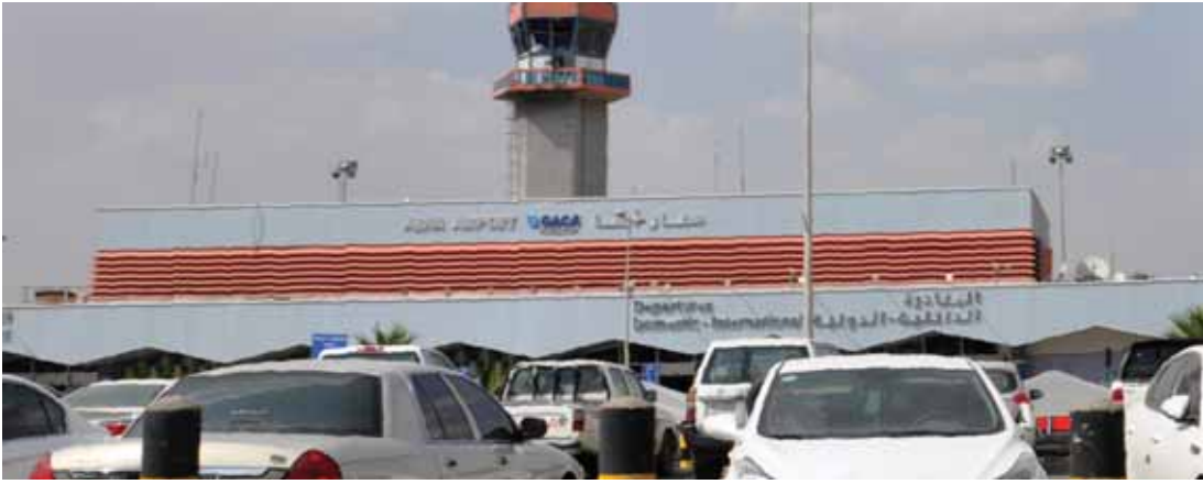
السعودية تعلن إصابة العشرات من جنسيات مختلفة إثر استهداف الحوثيين لمطار أبها (أ ف ب)

والحصار الجائر على اليمن فعلى المعتدي أن يتقن أننا لن نستسلم،» داعياً «جميع المواطنين والشركات العاملة في دول العدوان إلى الابتعاد عن كافة المطارات والمواقع العسكرية.» وتابع: «لن نألو جهداً في ردع العدو ورفعه، وبغية وظلمه على شعبنا اليمني وهو أمر فكثته لنا جميع القوانين الدولية والأعراف البشرية.» ويأتي هذا الهجوم في أعقاب هجوم آخر باستخدام طائرات مسيرة مسلحة في الشهر الماضي استهدف محطتي ضح للخط السعودي أعلن الحوثيون المسؤولية عنه. وهدد متحدث عسكري باسم الحوثيين يوم