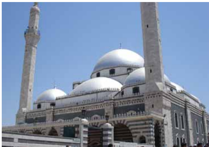
جامع خالد بن الوليد - حمص