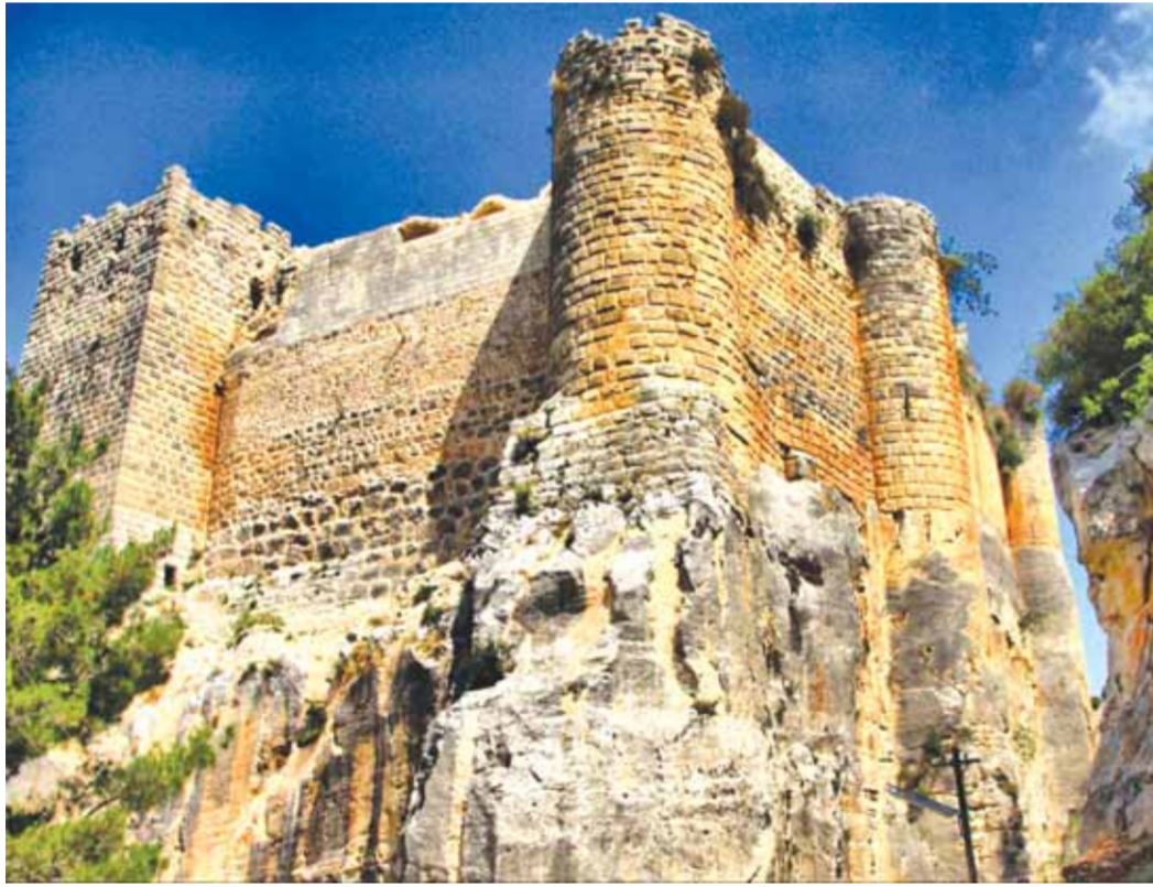
قلعة صلاح الدين

منذ بداية ٢٠٠٢ بدأت مؤسسة الأغا خان العالمية نشاطها في سورية من خلال مؤسستها الثقافية فباشرت في ترميم الآثار الإنسانية المسجلة عالمياً كآثار يجب الحفاظ عليها مثل «قلعة حلب وقلعة صلاح الدين وقلعة مصيف» ثم امتد نشاطها إلى دمشق القديمة فاختارت ثلاثة من الكنوز التراثية الدمشقية هي «بيت القوتلي وبيت السباعي وبيت نظام» وتعمل على ترميمها وإعادةها إلى وظيفتها التي وضعت لأجلها وذلك بخبرات عالمية وبأيدي عاملة سورية ومدربة. وبعد ماتم في حلب من تدمير اختارت الشبكة سوق حلب القديم المسجل في قائمة التراث العالمي ومنه اختارت سوقاً لم يكن مدمراً بشكل كبير وأعادتة أفضل مما كان وأضافته إليه المزايا الحضارية كاملة هو سوق السقراطية الذي سيتم افتتاحه قريباً في احتفالية كبرى تكون أنموذجاً للحفاظ على التراث.