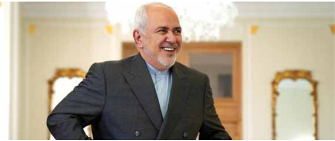
وزير الخارجية الإيراني محمد جواد ظريف

قال وزير الخارجية الإيراني محمد جواد ظريف إن أميركا لم ترحب أي حرب في التاريخ المعاصر، ولهذا السبب اضطرت إلى فرض الحظر على المؤسسات والأجهزة الإيرانية وقائد الثورة وعليه هو شخصياً.