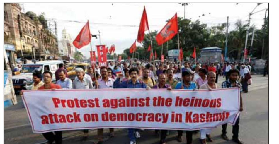
احتجاجات في الهند على قرار إلغاء الحكم الذاتي لكشمير (رويترز)

أعلنت الحكومة الهندية أمس إلغاء الحكم الذاتي الذي تتمتع به منطقة كشمير دستورياً، وذلك بموجب مرسوم رئاسي خاص ووضعت جيشها وطيرانها الحربي في حالة تأهب قصوى، وبدوره ندد وزير الخارجية الباكستاني بالقرار.