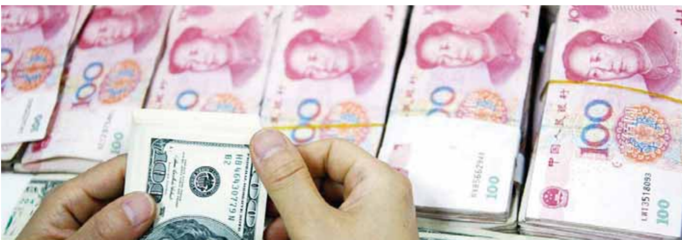
خسائر اليوان دفعت العديد من عملات المنطقة للهبوط

المستثمرين للجوء للأصول، حيث ارتفع الين الياباني لأعلى مستوى في ٧ أشهر مقابل الدولار.