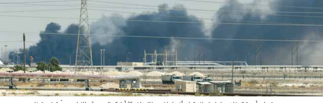
تصاعد أعمدة الدخان جراء استهداف قوات أنصار الله مصفاة شركة أرامكو السعودية بطائرات مسيرة

وكالات في رد يمني مؤلم هو الأقوى منذ بدء العدوان على الشعب اليمني والذي تسبب بمقتل عشرات الآلاف من اليمنيين وتدمير البنى التحتية للبلاد، استهدفت هجوماً بطائرات من دون طيار شركة أرامكو في عمق السعودية أمس، ما أدى إلى نشوب حريق كبير في منشأتين نفطيتين تابعيتين لها. وجاء في بيان صادر عن القوات المسلحة اليمنية، «إن سلاح الجو المسير نفذ عملية هجومية واسعة بعشر طائرات مسيرة، استهدفت منشأتين نفطيتين تابعيتين لشركة أرامكو أصابت أهدافها بدقة»، مبيّناً أن هذه العملية تأتي في إطار الحق المشروع والطبيعي في الرد على جرائم العدوان السعودي وحصاره المستمر على اليمن منذ خمس سنوات. ولفت البيان إلى أن هذه العملية تعتبر إحدى أكبر العمليات في العمق السعودي، وجاءت بعد عملية استخباراتية دقيقة ورسد مسبق، وتوعدت القوات المسلحة اليمنية للبلاد، استهدفت هجوماً بطائرات من دون طيار شركة أرامكو في عمق السعودية أمس، ما أدى إلى نشوب حريق كبير في منشأتين نفطيتين تابعيتين لها. وجاء في بيان صادر عن القوات المسلحة اليمنية، «إن سلاح الجو المسير نفذ عملية هجومية واسعة بعشر طائرات مسيرة، استهدفت منشأتين نفطيتين تابعيتين لشركة أرامكو أصابت أهدافها بدقة»، مبيّناً أن هذه العملية تأتي في إطار الحق المشروع والطبيعي في الرد على جرائم العدوان السعودي وحصاره المستمر على اليمن منذ خمس سنوات. ولفت البيان إلى أن هذه العملية تعتبر إحدى أكبر العمليات في العمق السعودي، وجاءت بعد عملية استخباراتية دقيقة ورسد مسبق، وتوعدت القوات المسلحة اليمنية للبلاد، استهدفت هجوماً بطائرات من دون طيار شركة أرامكو في عمق السعودية أمس، ما أدى إلى نشوب حريق كبير في منشأتين نفطيتين تابعيتين لها.