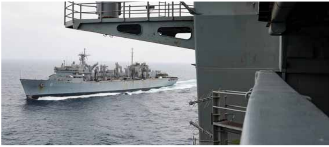
قوات البحرية الأميركية في الخليج العربي

كشف قائد القوة الجوفضائية لحرس الثورة الإسلامية الإيرانية العميد أمير علي حاجي زادة أنه بعد إسقاط طائرة التجسس الأميركية المسيرة تم توجيه صواريخ حرس الثورة الإسلامية نحو أهداف أخرى، في وقت أكد رئيس لجنة الأمن القومي والسياسة الخارجية في مجلس الشورى الإسلامي الإيراني مجتبي ذو النوري أن الأوروبيين يسعون من أجل الإبقاء على الاتفاق النووي مع إيران من دون أن يتحملوا أي تكلفة.