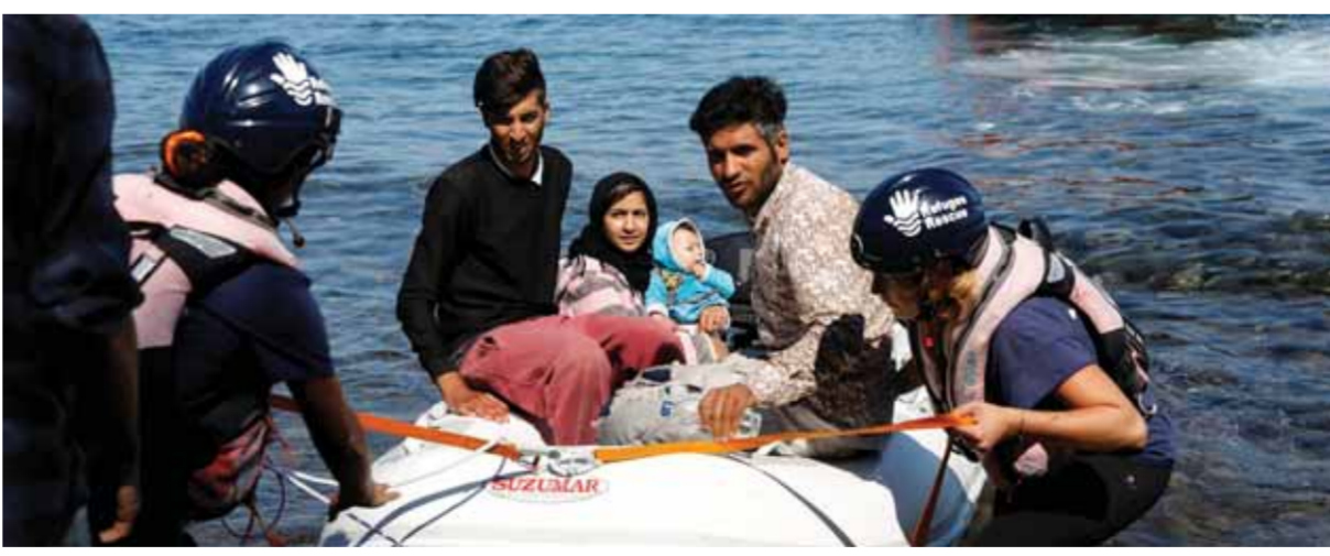
إنقاذ عدد من المهاجرين خلال محاولة الهروب من تركيا إلى اليونان

تجدر الإشارة إلى أن تركيا والاتحاد الأوروبي توصلا في ١٨ آذار ٢٠١٦ في العاصمة البلجيكية بروكسل إلى اتفاق يهدف لمكافحة الهجرة غير