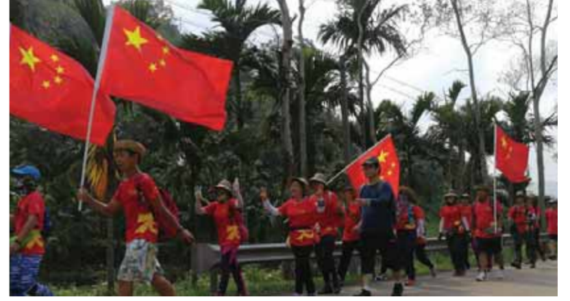
احتفالات بشوارع مدينة دينغان

الحزام والطريق والتي تسعى لإحياء طريق الحرير القديم الذي وصل الشرق بالغرب حضارياً وتجارياً لقرون عديدة قبل عصر الهيمنة الأوروبية، حيث شكّل هذا الطريق التاريخي جسراً للتبادل الحضاري عبرت من خلاله الأفكار والثقافات.