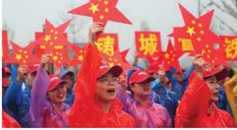
مقاطعة تشجيانغ تشند للصين أغاني وطنية