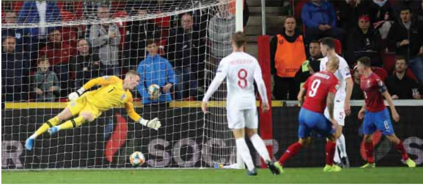
هدف الفوز لتشيكيا على إنكلترا

على لائحة الأكثر ظهوراً مع الزرق معززاً مركزه دولياً قبل ثلاث سنوات خاض خلالها ١٥ مباراة وأندراسيك الذي خاض مباراته الدولية الأولى، وبالتالي جاء فوز التشيك لينعش أماله ليواصل ظهوره في البطولة وهو الذي لم يغيب عنها منذ إنصاله عن جاره السلوفاكي، الخسارة هي الأولى لإنكلترا في التصفيات الموندبالية أو القارية منذ ١٠ أعوام بالتزامن والكمال ويومها كانت الخسارة أمام أوكرانيا بهدف بتصفيات مونديال ٢٠١٠.