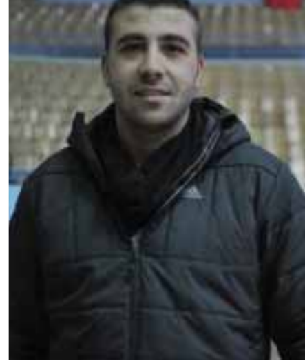
على سبيل الإعادة.