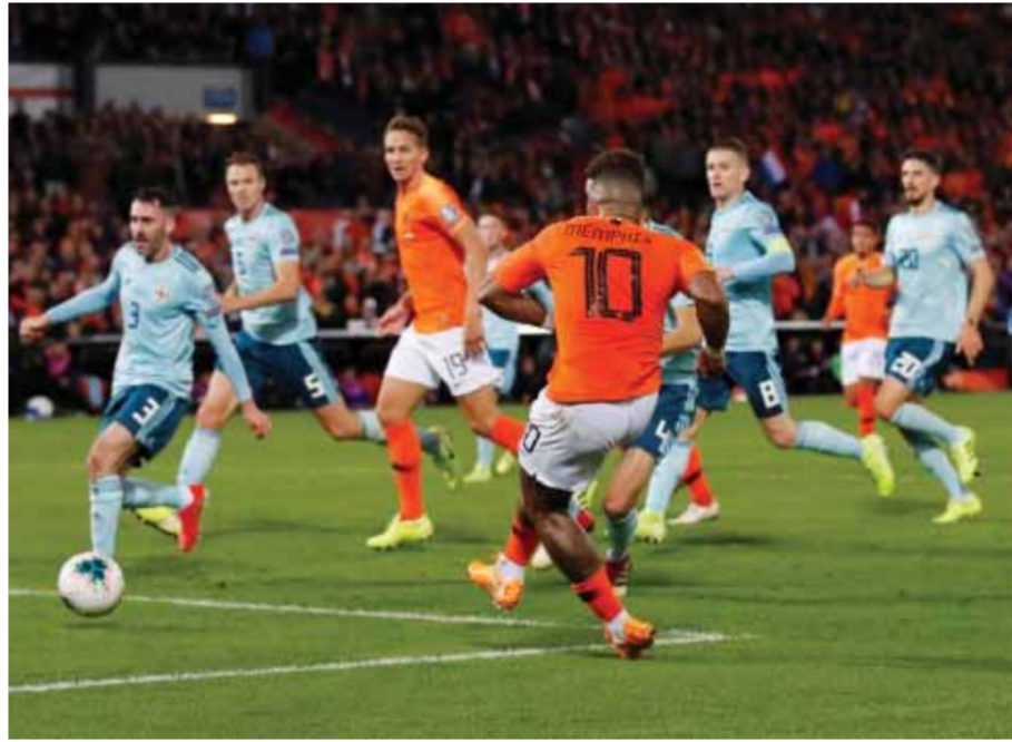
دييبي سجل هدفين لهولندا

في براغ تقدم الإنكليزي بهدف مبكر عبر ركلة جزاء لهدفهم هاري كين إلا أن التشيك لم ينتظروا طويلاً ليدركوا التعادل وسارت الأمور سجالاً حتى وقت متأخر عندما ضرب أصحاب الأرض بمقتل بهدف ثانياً ليتزولا الهزيمة الأولى بالأسود الثلاثة والطريف