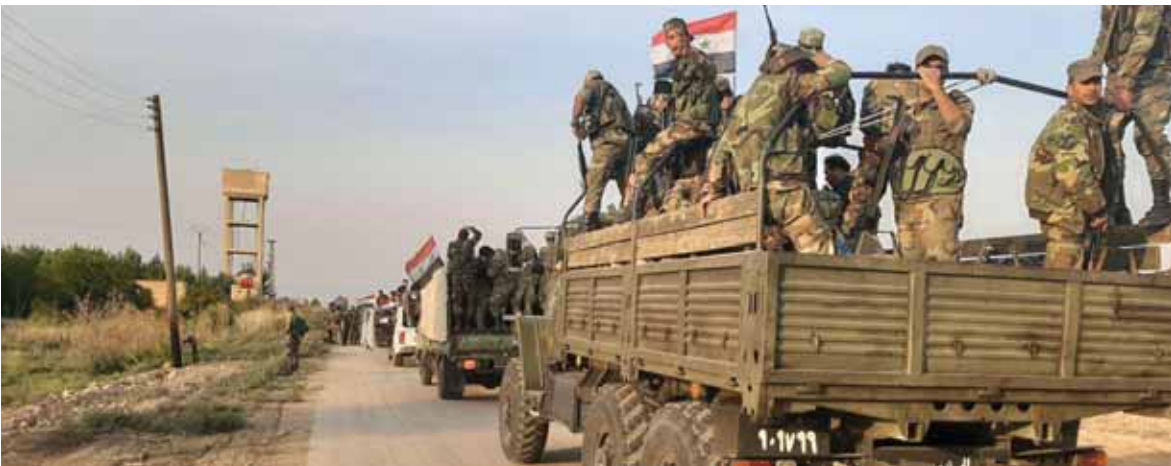
الجيش السوري يواصل انتشاره على الحدود السورية التركية

ووفق الوكالة، فإن الشرطة العسكرية الروسية، ستبدأ دوريات في هذه المنطقة الإستراتيجية، اعتباراً من يوم أمس. وتم بناء محطة «تشرين» لتوليد الطاقة منذ ٢٠ سنة على نهر الفرات، وهي على بعد ٩٠ كم من مدينة حلب، وعمل على بنائها مهندسون روس وسوريون، وتنتج نحو ٦٣٠ ميغاواط. وكان الجيش العربي السوري، استعاد في وقت سابق السيطرة على أكبر محطة كهرومائية في مدينة الرقة التابعة محافظة الرقة، بعد